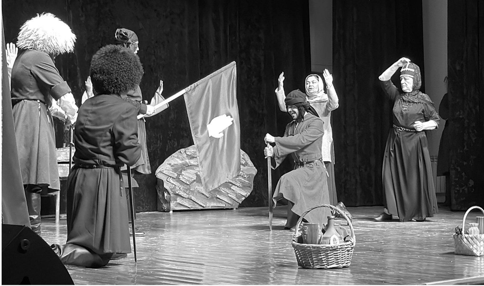
Сцена из спектакля «Ахырцыв. Единоборец-предводитель»

В течение месяца труппа Государственного республиканского абазинского драматического театра активно репетировала спектакль. Для его постановки были приглашены режиссер Абхазского государственного драматического театра имени Самсона Чанба Алхас Шамба. Это его первый опыт работы с актёрами абазинского театра Карачаево-Черкесии.