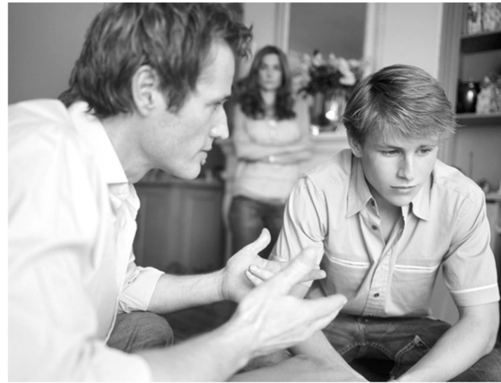
Родители всегда должны быть открыты для диалога с ребенком

Интересоваться его увлечениями. Вам может быть абсо-