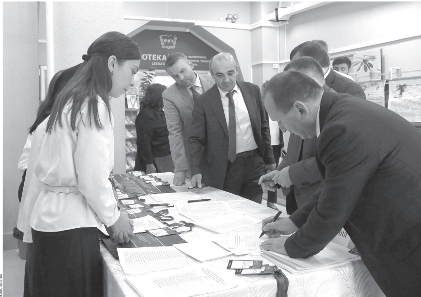
Почетные гости, прибывшие на конференцию, проходят регистрацию