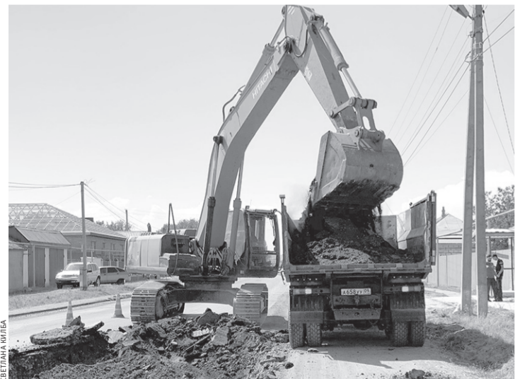
Работа на ремонтируемом участке ведется без перебоев

Завершается реконструкция автодороги «Черкесск-Хабез-подъезд к МЦО „Архыз“»