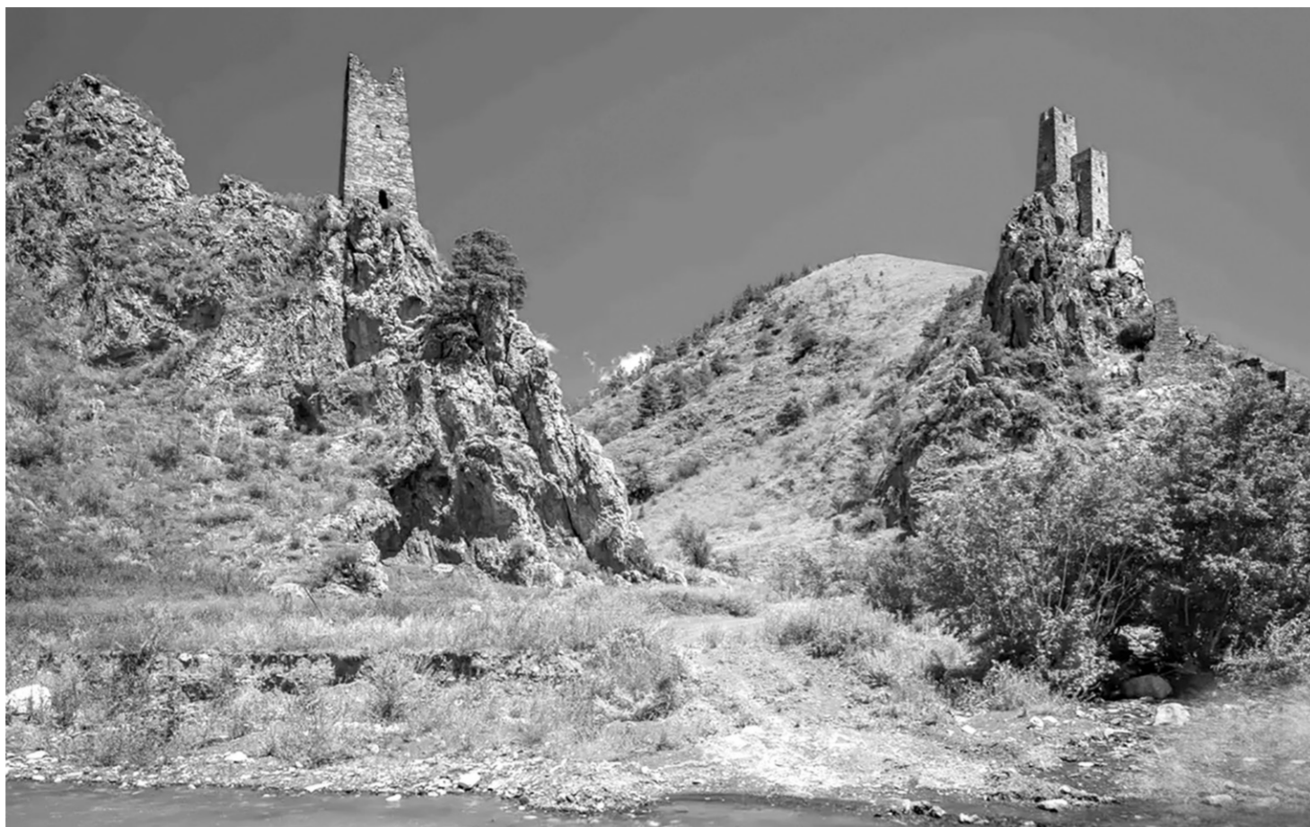
Вовнушки — визитная карточка Джейрахского района

Комплексы «Эгикал», «Хамхи» и «Таргим», согласно легенде, основаны тремя родными братьями. Некогда в этой местности поселился человек по имени Альберд, у которого было три сына — Эги, Хамхи и Таргим. И вот, когда сыновья повзрослели, отец спросил, каким образом каждый из них собирается обустроить свою жизнь.