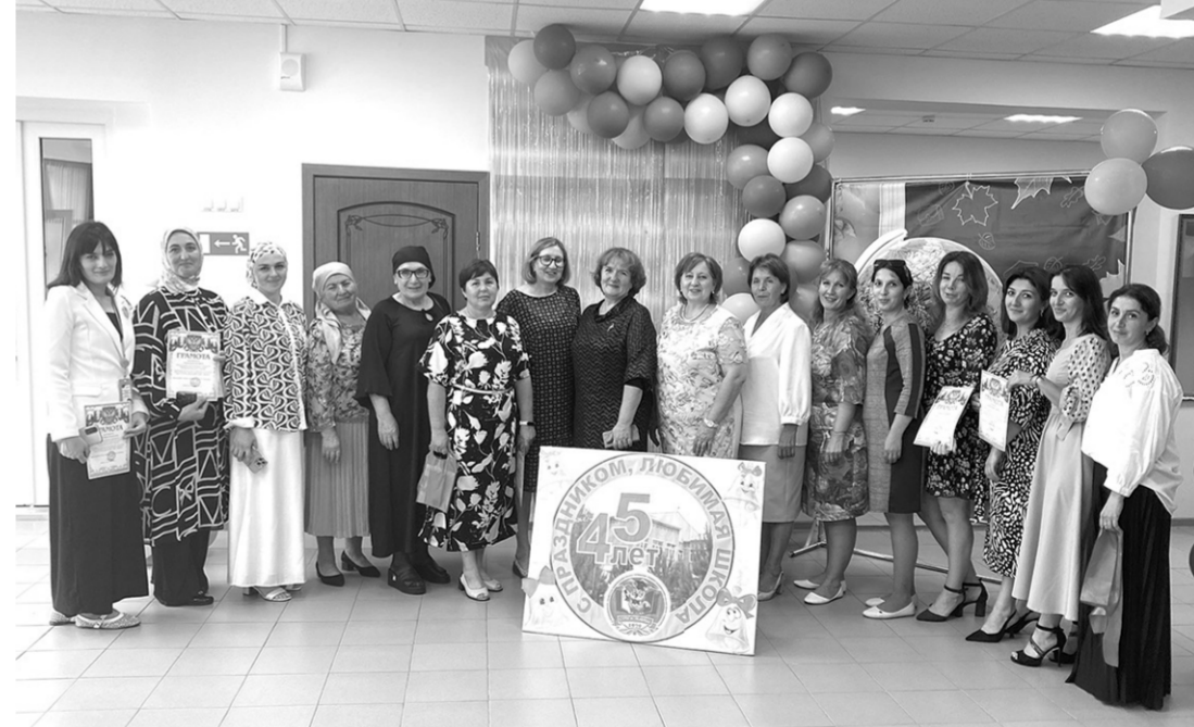
Дружный коллектив Майской СОШ